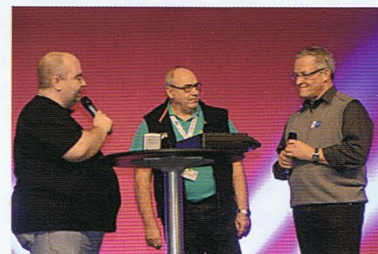
Um „Aerotest“ ging es auch auf der Showbühne, diesmal für das breite Publikum