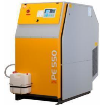
PE 550-VE mit SUPER SILENT-Verkleidung