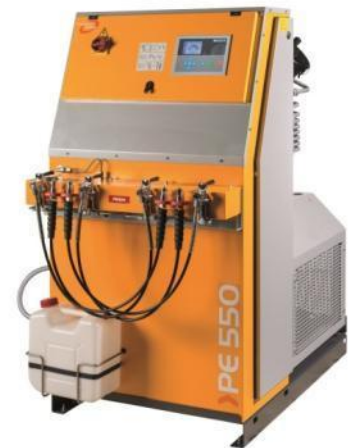
PE 550-VE inkl. Fülleiste mit Schlauchanschlüssen