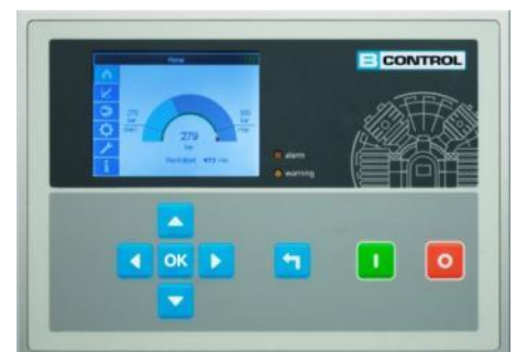
B-CONTROL MICRO Display

Die B-CONTROL MICRO ist eine moderne, einfach zu bedienende Kompressorsteuerung mit Farbdisplay, die alle Basisfunktionen des Kompressors intelligent steuert und sicher überwacht. Benutzerfreundliche Navigation und übersichtliche Darstellungen der wichtigsten Kompressorparametern auf dem Display.