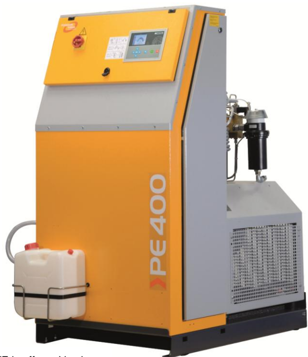
PE 400-VE in offener Version