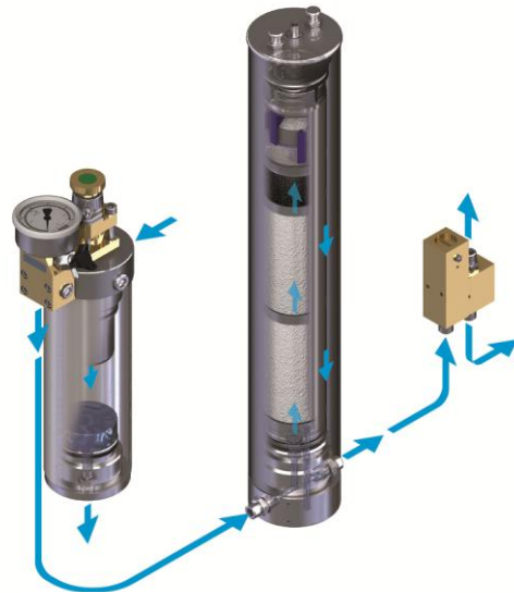
Filtersystem P61/350 (Abbildung ähnlich)