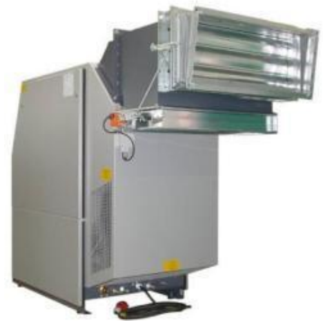
Abluftschacht mit Lüftungsclappen montiert an einem PE-VE

Ein Abluftschacht mit Lüftungsclappen dient bei der Installation des Kompressors in einem Container oder Kompressorraum, zum Regulieren der Umgebungstemperatur. Bei niedriger Umgebungstemperatur (z.B. < +5 \text{ °C} ) heizt die erwärmte Kühlluft den Raum auf, bei Erreichen von hohen Umgebungstemperaturen wird die erwärmte Kühlluft ins Freie geleitet.