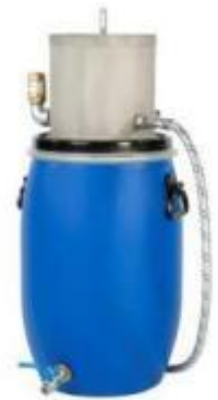
40 l Kondensatsammelsystem