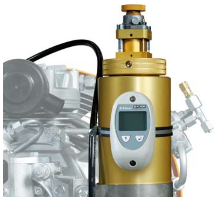
P-31 Filtersystem mit B-TIMER - Sicherheit auf einen Blick