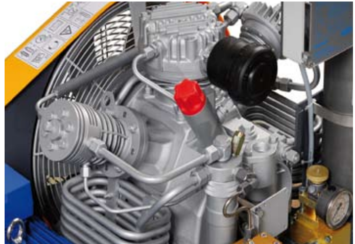
Robuster und langlebiger IK 120 Kompressorblock